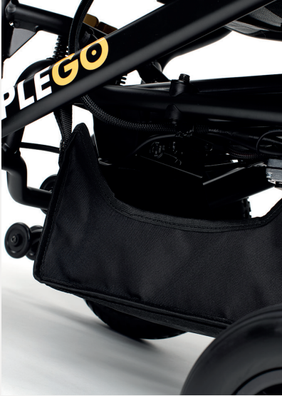
B64 AUFBEWAHRUNGSTASCHE UNTER DEM SITZ