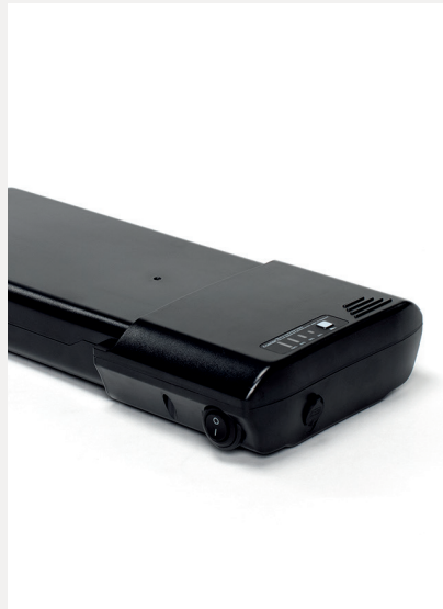
EXTRA BATTERIE 12,8 AH ODER 17,5 AH

Um einer Vielzahl von Vorlieben und Bedürfnissen gerecht zu werden, bieten wir mehrere Optionen für Ihren Plego an. Lagern Sie Ihren Plego oder fügen Sie einige zusätzliche Funktionen hinzu, die zu Ihnen und Ihren Bedürfnissen passen.