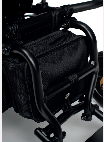
B63 AUFBEWAHRUNGSTASCHE HINTER DER FUSSTÜTZE