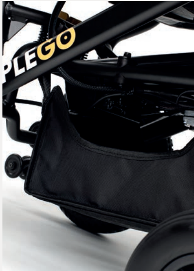
B64 AUFBEWAHRUNGSTASCHE UNTER DEM SITZ