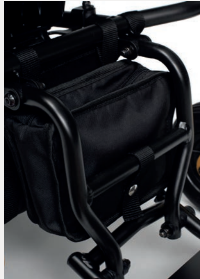
B63 AUFBEWAHRUNGSTASCHE HINTER DER FUSSTÜTZE