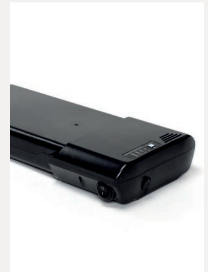
EXTRA BATTERIE 12,8 AH ODER 17,5 AH

Um einer Vielzahl von Vorlieben und Bedürfnissen gerecht zu werden, bieten wir mehrere Optionen für Ihren Plego an. Lagern Sie Ihren Plego oder fügen Sie einige zusätzliche Funktionen hinzu, die zu Ihnen und Ihren Bedürfnissen passen.